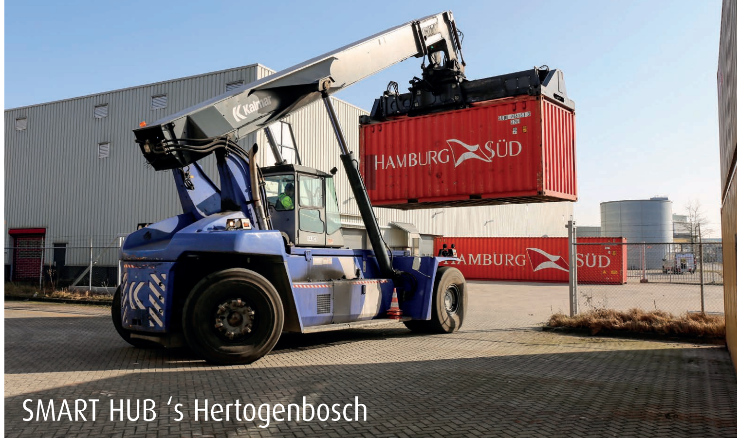
SMART HUB 's Hertogenbosch